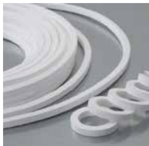
LATTYflon 3206 S Chemisch inerte Packung für statische Anwendungen