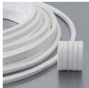
LATTYflon 3206 SO Packung für Anwendungen mit Sauerstoff und Lebensmitteln